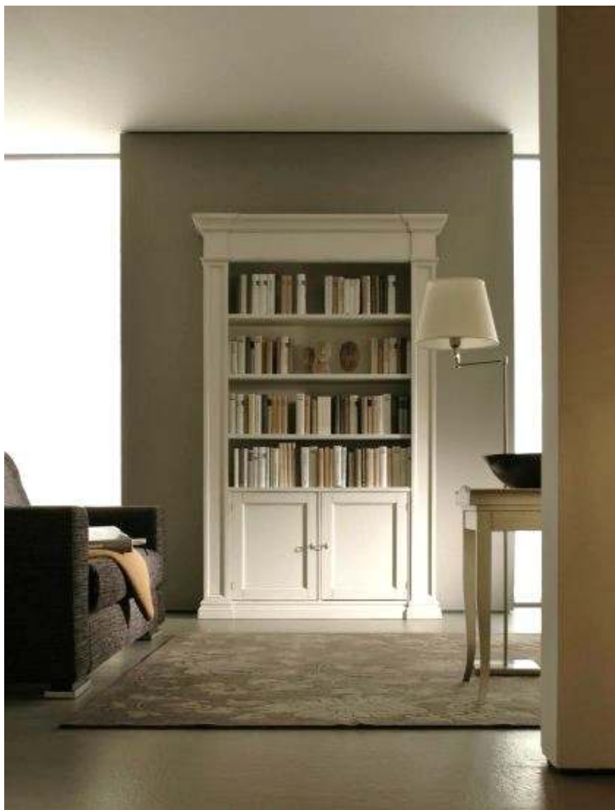
PR-3923 - 140 x 40 x 220 cm