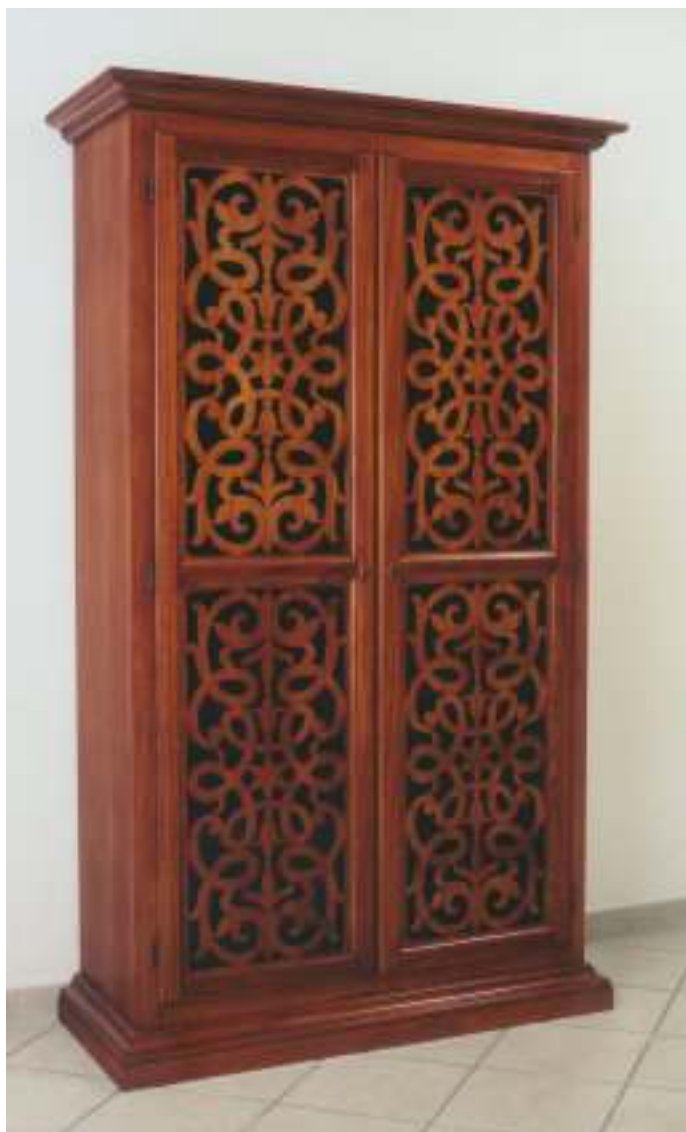
PR-V0993E0 - 120 x 50 x 195 cm