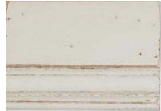
PR-1279 - WEISS-ANTIK

Dies ist nur eine kleine Auswahl an Holzmustern. In unserem Programm befinden sich noch zahlreiche andere Holz Ausführungen.