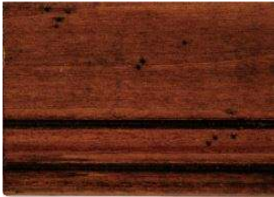
PR-1385-1 - KIRSCH