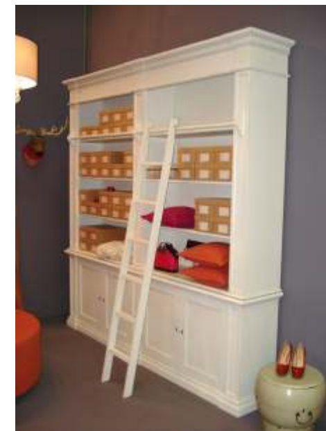
PR-4607 (Option Leiter) - 254 x 44 x 250 cm