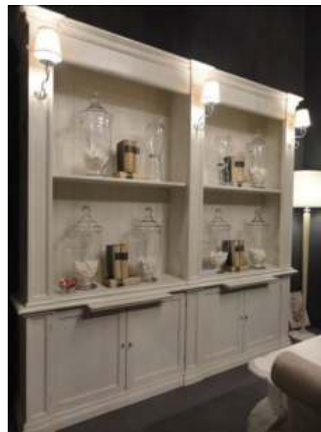
PR-4607 (Option Lampen) - 254 x 44 x 250 cm