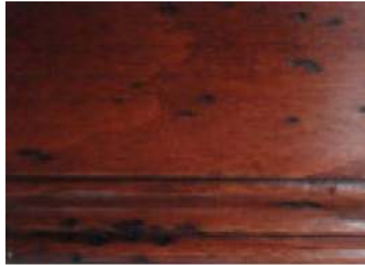
PR-0298-1 - WALNUSS