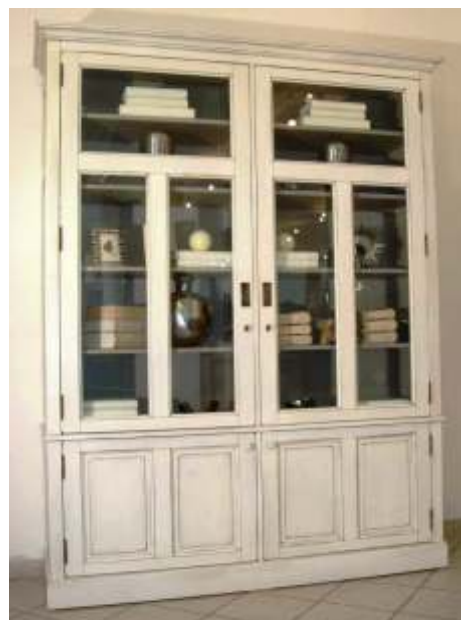
PR-4306 - 174 x 49 x 228 cm