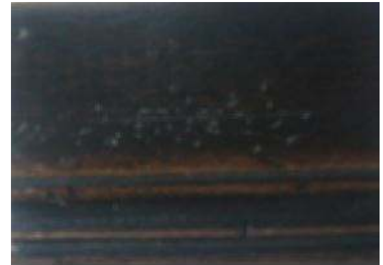
PR-1237-1 - SCHWARZ-ANTIK