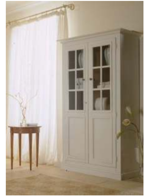
PR-1175 - 111 x 46 x 184 cm