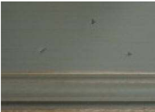
PR-1276-8 - GRAU