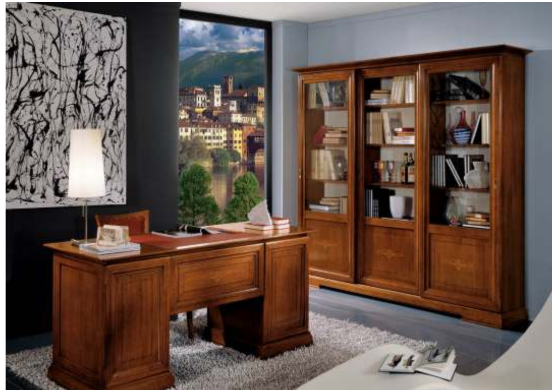
PR-1017- 236 x 48 x 219 cm - Bücherschrank