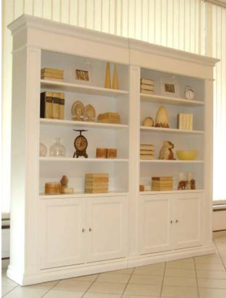
PR-3918 - 254 x 40 x 220 cm