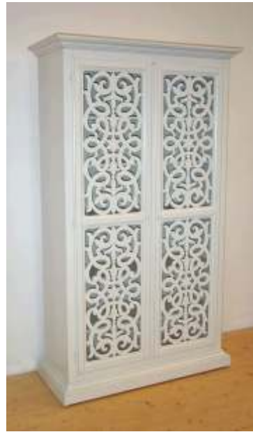
PR-V0093E0 - 114 x 48 x 195 cm